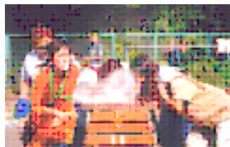
みんな必死です あめ食い競争