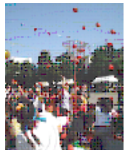
元気いっぱい 玉入れです

対抗競技とは別に、「置き換えリレー」や「玉入れ」など、子供から大人まで楽しめる競技もたくさんで、各町内の方も張り切って参加されていました。