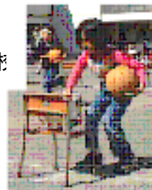
間違えないでね 置き換えリレー