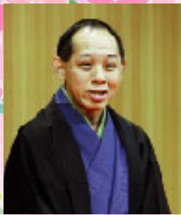
古今亭菊春(第1,7,11回興行ゲスト)