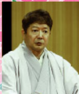
金原亭世之介(第2回興行ゲスト)